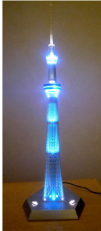
会場を飾る東京スカイツリー模型 東京世田谷中央 RC よりいただきました