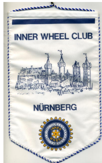
ドイツ・ニュルンベルクのインナーホイールクラブ