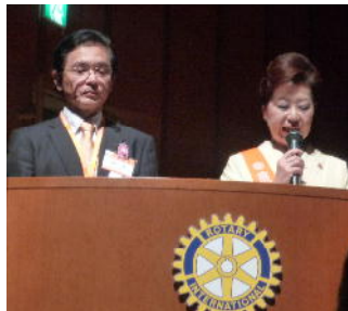
司会の若狭会員と井口会員