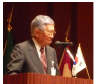
中尾哲雄ガバナーエレクト