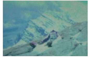
記念講演 登山家 栗城史多氏の NOLIMIT ~ エベレスト無酸素登山チャレンジ