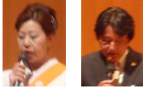
司会の井口会員と岩倉会員