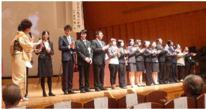
地区 米山記念奨学生