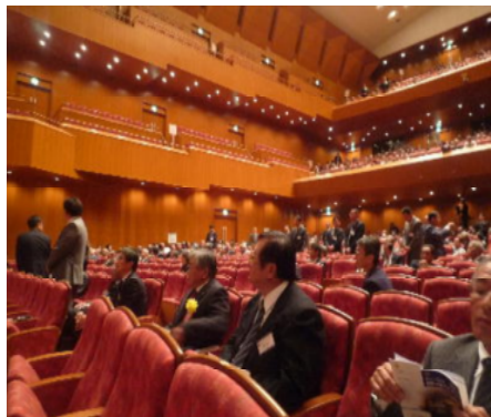
大分閑散となった会場