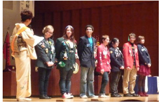
地区国際交換学生