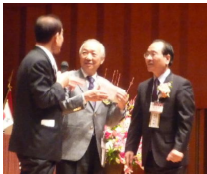
地区大会を記念してラオス事業に 20 万円を寄贈された李承采 RI 会長代理