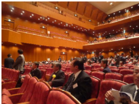
大分閑散となった会場