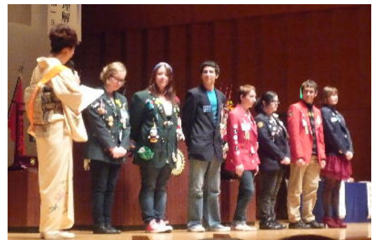
地区国際交換学生