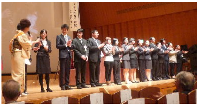
地区 米山記念奨学生