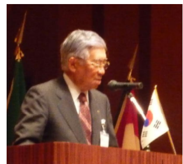
中尾哲雄ガバナーエレクト