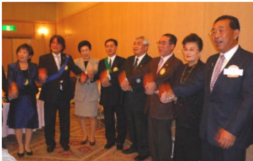
ロータリーソング 『 手に手つないで 』