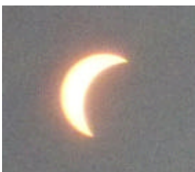
7/22 部分日食 金沢市彦三町にて撮影 石丸