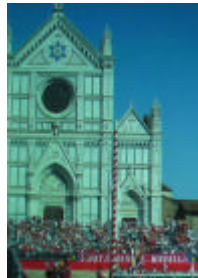
サンタクロツェ教会