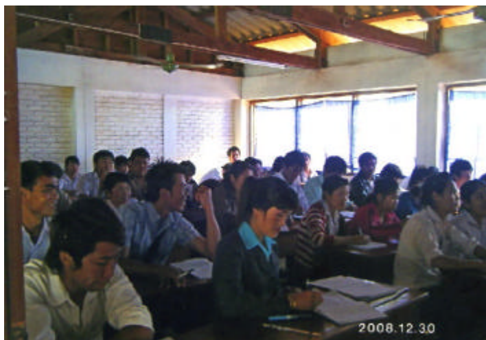
沢山の受講生で大人気のラオスITセンター