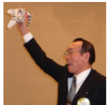
クイズ当選の野城会員