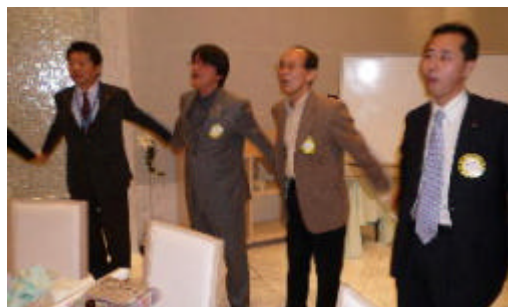
手に手つないでの合唱で終了