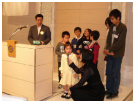
新入会員と次世代のロータリアンの紹介

ロータリーの友1月号の世界にはばたけ米山 学友 の中の「子どものみらいの夢をつかめる国 に」でラオスを紹介した。