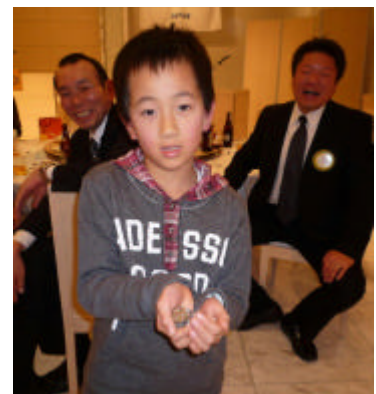
100yenゲームで優勝 ビックリ(全部ジャンケン 負けとは)