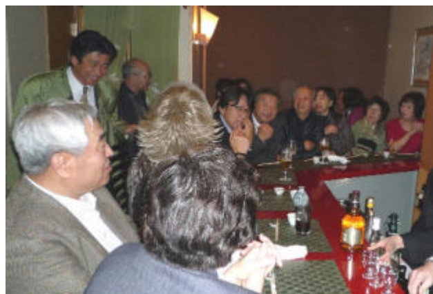
2次会は主計町 えんやにて