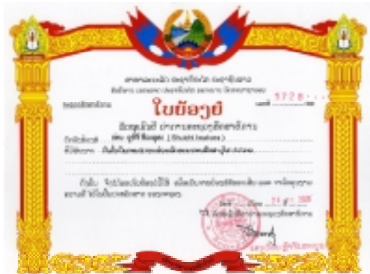
ラオス教育省からの感謝状 ラオス訪問の記は次号予定