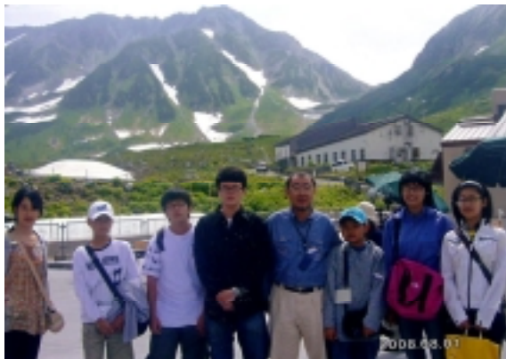
8.1 立山へ 金会員・比良会員 魏会員令嬢も