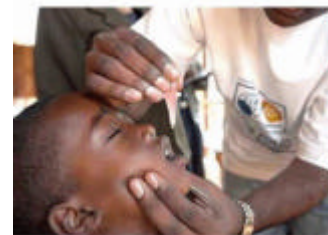
ロータリーの友のウェブ版

『ロータリーの友』では、会員の皆さまのご投稿をお待ちしております。クラブや地区での活動、ロータリアン同士の交流に関する原稿や写真、ロータリーに対するご意見など、ロータリーの友事務局までお送りください。なお、別に、特集用の原稿を募集させていただくこともあります。時折、当ウェブサイトの「ロータリーの友からのお知らせ」をチェックしてください。