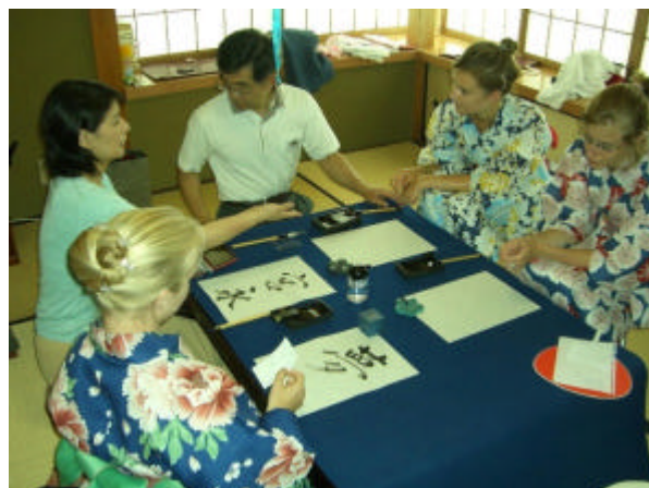
書道にチャレンジ、なかなか達筆