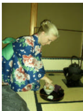
茶道にチャレンジ