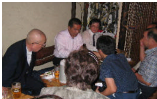
例会後も近くの飲食店(zadan)で意見をかわす。

さて原爆症の方は国内に現在 25 万人いますが、2,200 人のみが原爆症として認定されています。直接の被爆でなくても原爆症になった人は沢山います。すでに 6 つ裁判で敗訴です。確かに見解がずれています。 - - - - - 点 鐘