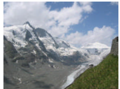
オーストリアー最高峰グロスグロックナー山 3798m

市の中央部 国立オペラ座の隣の高級ホテル ザッハホテルで午後1時から約1時間半おこなわれました。宮殿のホテルですので飾り付けは豪華でロータリアンでなければ入りにくい雰囲気でした。会員は60名ほどですが当日の出席者は私と家内をいれて19名で、ここも出席率が悪いようでした。テーブルスピーチは移住外国人のお話でした。6/20 雄大なグロスグロックナー山は快晴にめぐまれ下には広がるのパステルツェ氷河を見ることができました。石丸幹夫