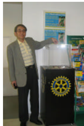
ウィーン空港にてポリオブラスの募金箱 石丸