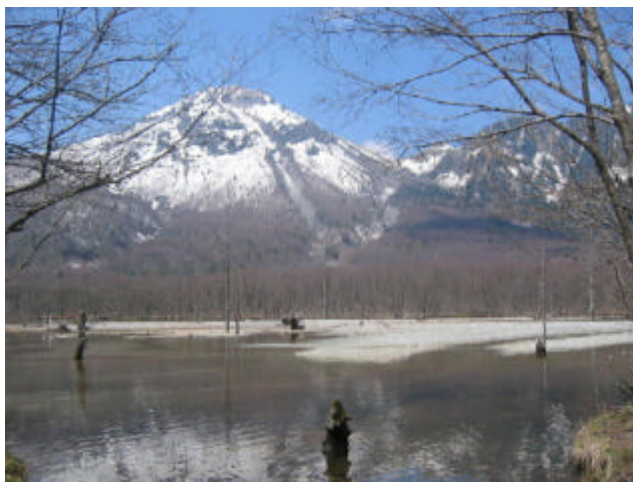
5/4 快晴の上高地 焼岳と大正池