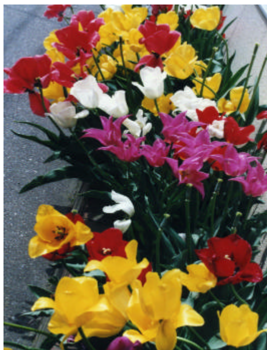
桜花散ってチューリップ（金沢市内）

関連記事を掲載）。この RI からの要請を受け、同クラブでは、3 月、4 月に、リアウインドウに「ロータリー世界平和フェロー募集中」のお知らせをつけたタクシー千数百台を走らせています。ちょうど春の観光シーズンに入った京都市内のあちらこちらで、これらのタクシーを見かけることができ、市民だけではなく、日本各地からの観光客にも、ロータリーの活動を知ってもらう絶好の機会となりました。地下道のウインドウで行き交う市民にロータリーを紹介。第 2650 地区・福井南ロータリークラブでは、人通りの多い地下道エレベータ横のショーウインドウを借りて、ロータリーの奉仕活動を一般の人々に知ってもらうという展示を今年度の広報活動として企画していました。