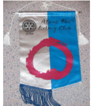
厚木 RC のバナー