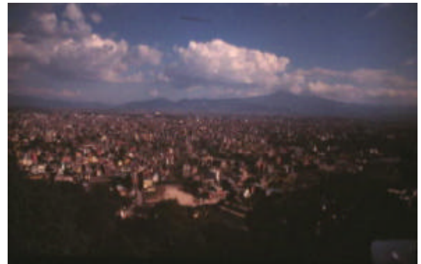
カトマンズ市街風景