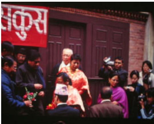
ゴールデンテンプル前にて