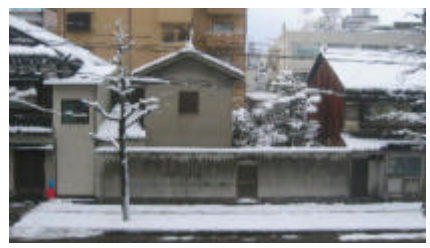
3/14 朝 可成り積雪がありました。