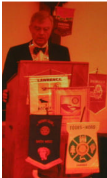
後ろに百万石 RC パナーが