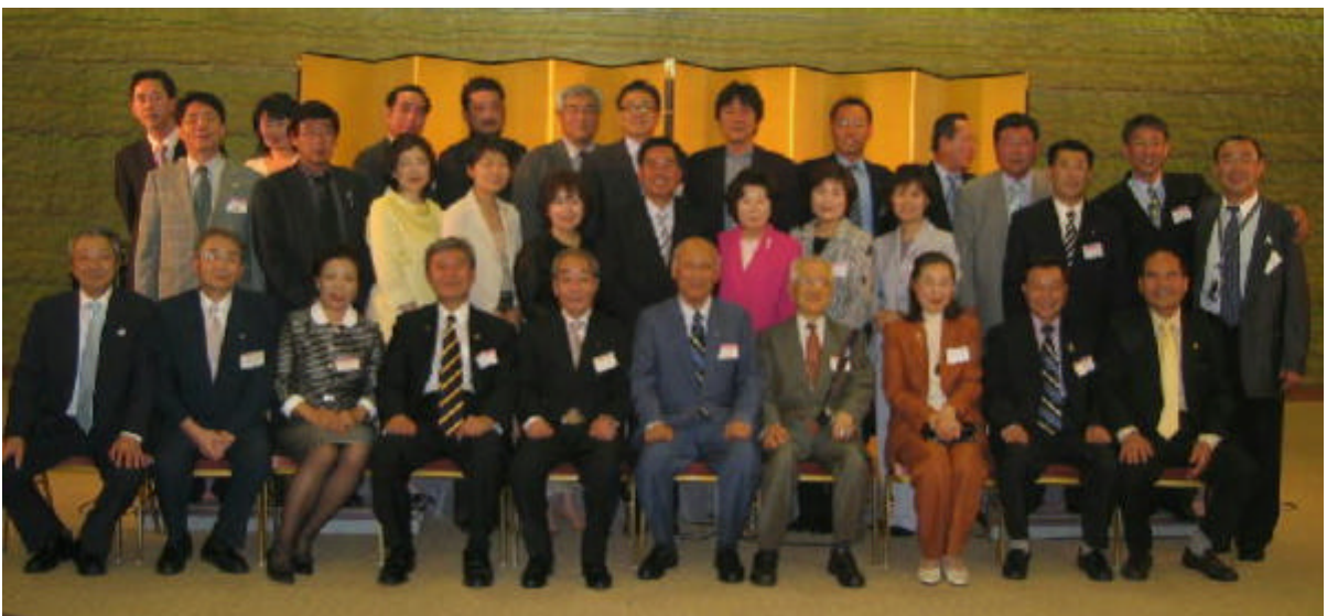
京都宝ヶ池プリンスホテルにて友好親睦会のスライドから