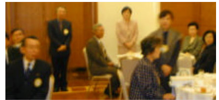
Happy birthday to you

北山吉明会員 3年に一回のリサイクルですが、このお金をチャイルドライン石川とメイクアウイッシュに寄付したいとおもいます。よろしくお願ひ致します。