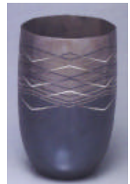
前田宏智会員作品