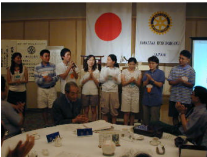
みんなで韓国の歌を合唱