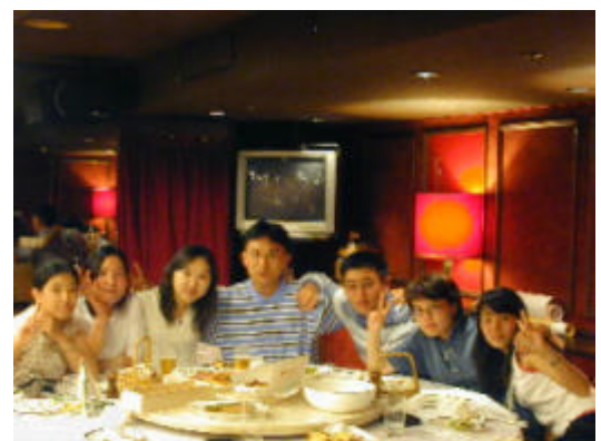
例会後ホテルイン金沢 14F にて さよならパーティ