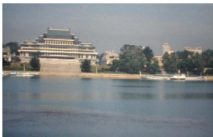
美しい平壤市と大同江