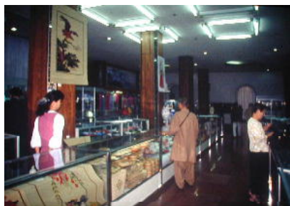
少し照明が暗いがデパートもよい