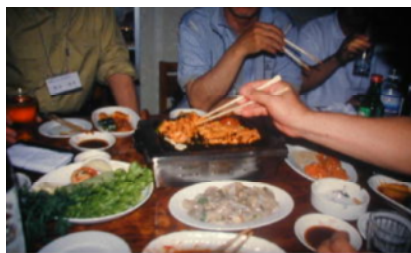
料理は平安冷麺はじめ大変美味