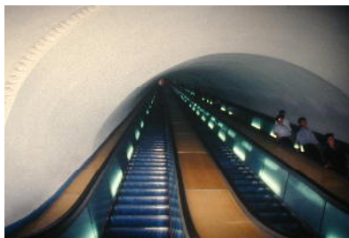
平壤の地下鉄の長いエスカレーター

今回、北朝鮮を訪問して参りました。日朝文化友好協会の招待があり、全日空機で大連へ行き、そこから、ロシアの飛行機で平壤に入りました。現在、この国はいろいろの問題を抱え、日本での評判は良くありませんが、訪問してみましたら、平壤の街は綺麗で素晴らしく、人々も親切で、子ども達への教育も熱心であり、なんと言っても子ども達の目がいきいきとしていました。行くところ行くところ整然とした美しさがあり、大ドームでのショーは最高でした。一糸乱れぬ統率はたいしたものでした。しかも食事はおいしく、わたしの見た限りでは何回でも再訪問したい気持ちになりました。