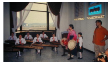
子どものいろんな才能を伸ばすための教室 生き生きした眼