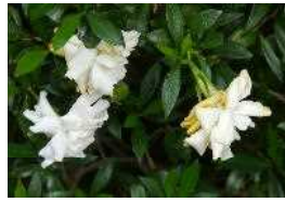
セントブレチア クチナシ (八重) 俗名 ヒメシヨウブ