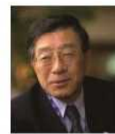
現職：東京医科大学名誉教授、国際医療福祉大学大学院主任教授、新座志木中央総合病院名誉院長

3/23付で東京世田谷中央ロータリークラブより下記案内が届きましたので、ご連絡いたします。