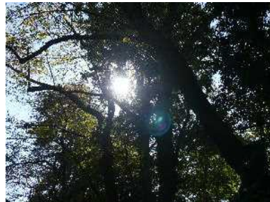
晩秋の木漏れ日 県立美術館にて