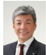
柳生好春ガバナー