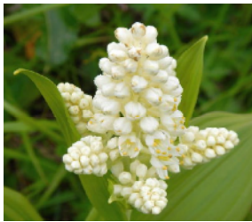
コバイケソウ 武藤