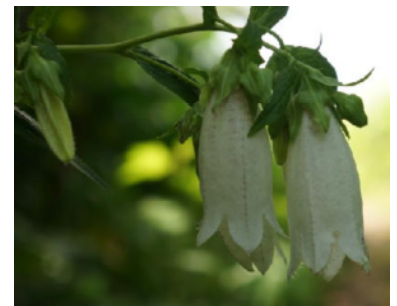
季節の花 7題 村田祐一会員より