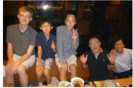
多くのクラブ会員と家族があつまり、にぎやかに談笑しました。