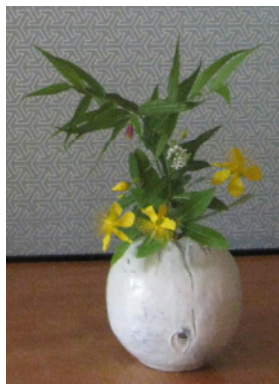
床のお花 未央柳 唐竹蘭 岡トラノオ