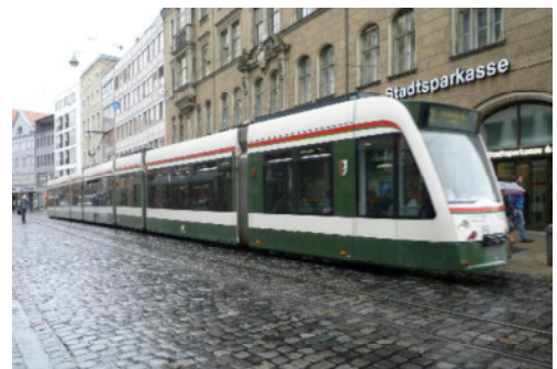
ドイツ ニュルンベルクのトラム

細かいことだが、ウィーンのマインストリートではトラムが両側歩道に沿って走り、車は中央を走っている。トラムは歩道にピタリと止まるので段差がなく車椅子、ベビーカー、買い物カートの乗降に大変良いと感じた。