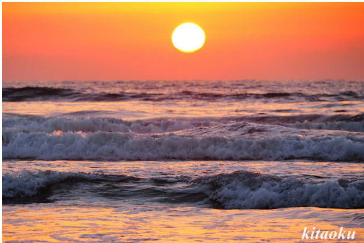
写真家 北奥耕一郎氏 (前京都北東 RC 会員) 提供の素晴らしい羽咋千里浜の落日 (無断使用禁止)