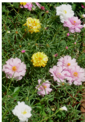
夏を惜しむ マツバボタン