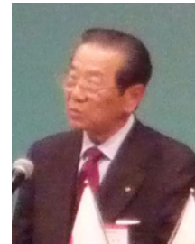
永田 義邦 ガバナーエレクト