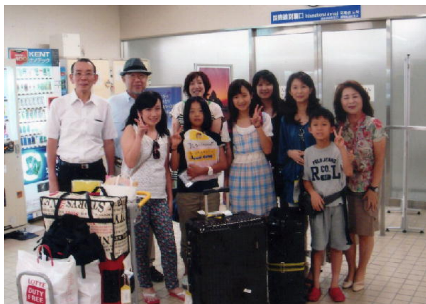
韓国青少年交換プログラム派遣学生とご家族