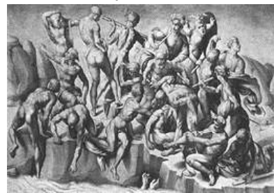
サンガロ ミケランジェロによる「カッシーネの戦い」模写

以外、他に取柄のないものだ」「高貴な人の芸術ではない」と言い、一方ミケランジェロの方でも「絵画などは、女子供に似合いの芸当だ」「オレみたいに少しは体を張った仕事をして