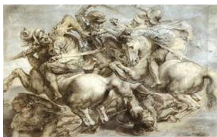
ルーベンス ダビンチによる「アンギアーリの戦い」模写

当時レオナルドはミケランジェロの様な彫刻家の仕事を「ほこりにまみれて、泥の様な大汗をかき、顔はベトベト、全身大理石の粉だらけで、まるで新入りのパン焼き職人のようだ」「彫刻なんてものは、もちが良い