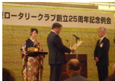
地区役員を長らくされた貢献 公文会員を表彰