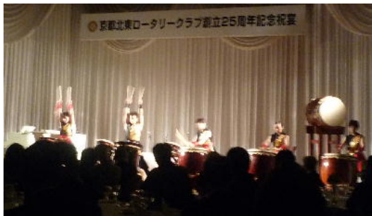
アトラクションの和太鼓