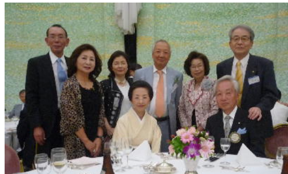
公文会員ご夫妻囲んで