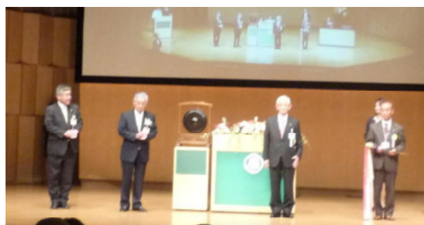
富山大手町 RC から小松 RC へ大会の鍵伝承