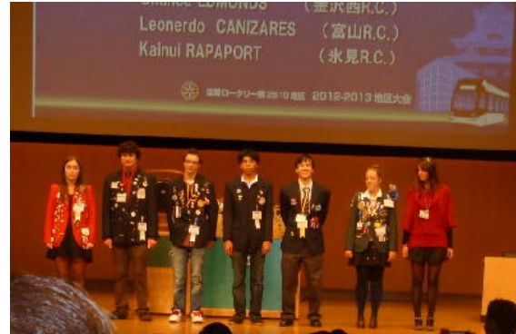
地区受け入れ交換学生