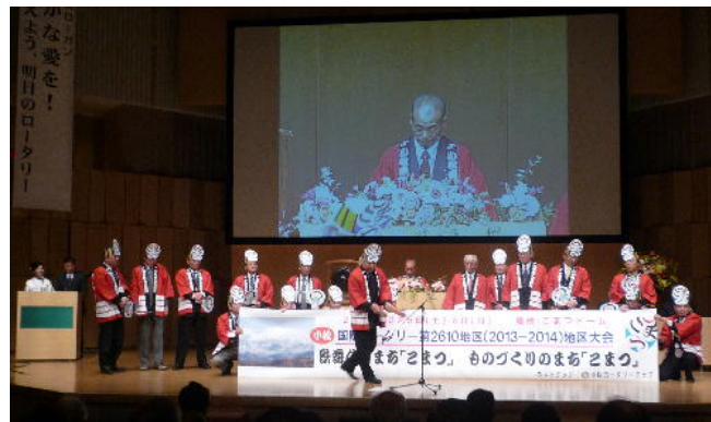
歌舞伎の町、ものづくりの街小松へ