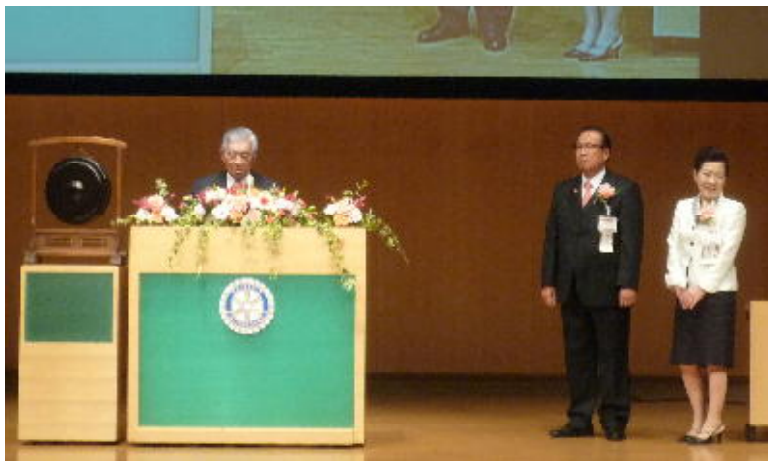
中尾ガバナーによる中村靖治 RI 会長代理ご夫妻の紹介