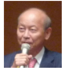
石井隆一富山県知事