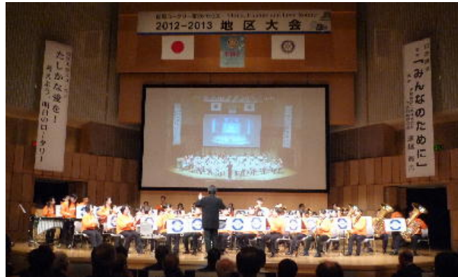
オープニングアトラクション富山商業高校吹奏楽部