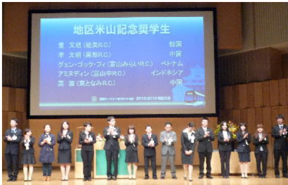
地区米山記念奨学生