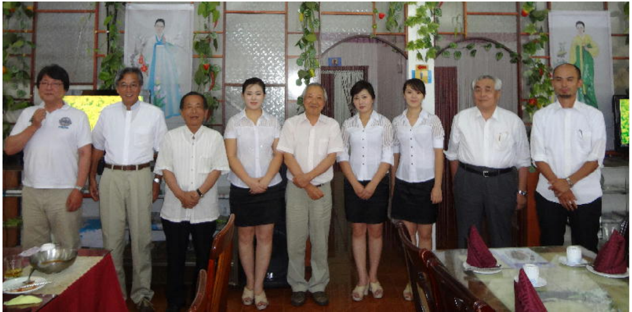
2012.9.28. 16時 朝鮮料理レストランにて