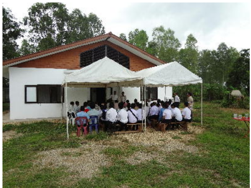
指導員宿泊研修所にて