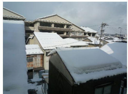
2012.2.18 (土) 朝 金沢は大雪注意報