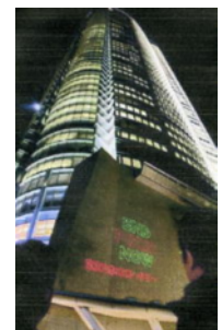
瀧誠四郎氏撮影 (写真：フジサンケイビジネスアイ)