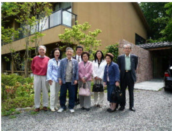
御殿場の橋氏が経営する立派な研修ホテルにて