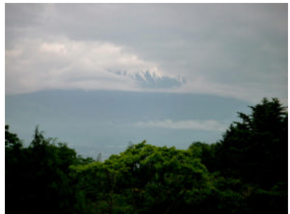
早朝の富士山 なかなか頂上はみせてくれなかった