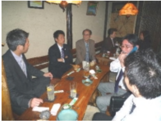
二次会は 恒例の「ZADAN」にて